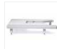
Table d'extension extra-large Pour manier facilement les tissus. Pratique pour le quilting et les projets de grande taille.

Kit pour travail à la canette Réalisez des coutures "à l'envers" (avec l'envers du tissu orienté vers le haut) en utilisant des fils décoratifs spéciaux trop gros pour le chas de l'aiguille.