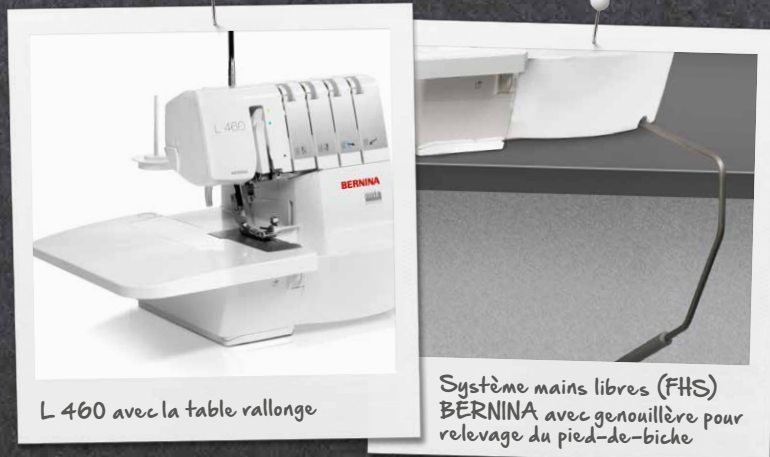
L 460 avec la table rallonge

L'espace de travail bien éclairé de cette surjeteuse facilite la couture et l'enfilage des crochets et des aiguilles. Le système mains libres (FHS) permet de monter et descendre le pied-de-biche à l'aide du genou; les deux mains sont donc libres d'orienter et d'entraîner le tissu. La table rallonge prolonge l'espace de travail, un plus indéniable pour les ouvrages de plus grande envergure.