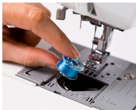
Mise en place rapide de la canette - placez tout simplement une canette pleine et vous pouvez commencer à coudre